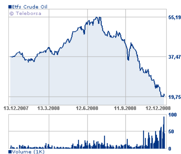
Grafico ETC Etf Brent 1mth Oil Securities